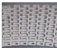
モジュールベルト 仕様